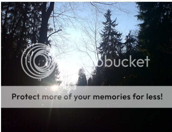
(Nebel, Visionen, Gewitter, Sturm, Gipfel spar ich mir...)