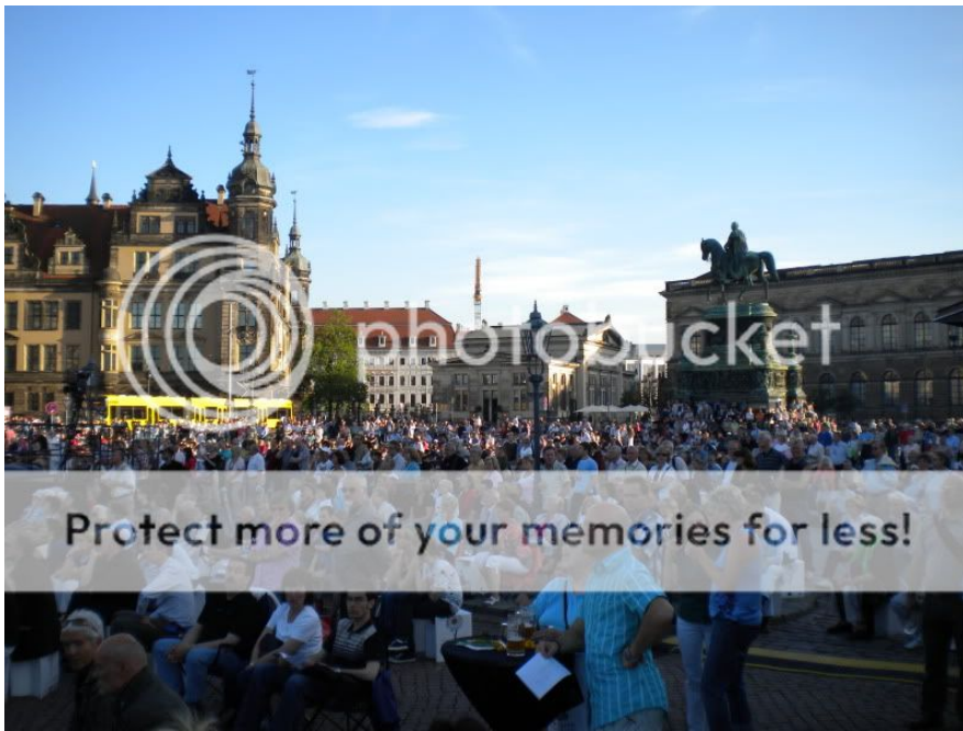
Publikum völlig im Bann der Oper - drinnen wie draußen.