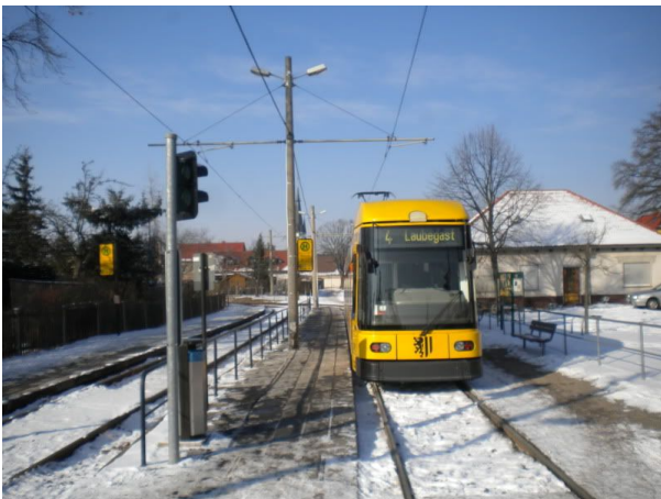
Ende einer langen Reise: Weinböhla

Am Sonntag fand endlich die verschobene Endhaltestellenwanderung nach Weinböhla statt. Man muss schon ein bisschen Zeit mitbringen, denn schon die Anreise dauert etwas: die Linie 4 hat die längste Strecke der Dresdner Straßenbahnlinien und durchquert mit Radebeul und Coswig zwei komplette Gemeinden - allerdings habe ich nicht herausbekommen, wie lange diese Linie (die früher einmal sogar an der anderen Seite in Pillnitz endete) schon existiert. Während die „4“ in Radebeul noch die Hauptstraße benutzt, biegt sie in Coswig in die Wohnviertel ab und fährt bis nach Weinböhla quasi mitten durch die Gärten, was einige Hauskatzen auch schonmal benötigt, neben der Bahn auf einem Kirschart zu warten, bevor der Sprung über die Schienen erfolgt.