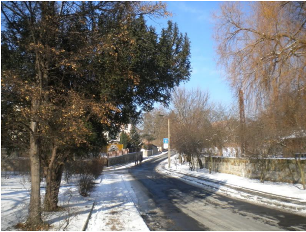
An der Nordstraße in Weinböhla

Summa summarum waren wir also 12km unterwegs, bedanken uns beim Landratsamt Meißen, dessen Markierungen immerhin so gut angebracht waren, dass wir nur an einer Gabelung den Weg verloren. (Allerdings fehlt nach der Eisenbahnunterführung in Weinböhla ebenfalls eine Fortführung, aber wir haben ja noch Nase und Sonnenstand...). Nach etwa einem Drittel des Weges lockte schon eine Einkehr in der Mistschänke in Steinbach, ein historischer Gasthof mit feinem Apfelkuchen und leider wieder einmal Bliemchenkaffee. Ansonsten war die Wanderung ein schönes Naturerlebnis mit ein paar erschreckten Wandergenossen („WAS? Sie wollen bis nach Moritzburg? Na, da hammsesisch ja was vorgenommen“)