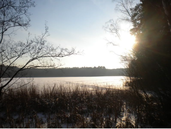
Stimmungsvoll: der zugefrorene Obere Altenteich

Nahe den Altenteichen kommt uns noch ein Trecker entgegen, der eine Handvoll Jugendlicher auf Schlitten zieht - ein kaltes und wohl nicht ganz ungefährliches Vergnügen, aber offenbar hatten alle Spaß dabei. Und in Moritzburg angekommen lohnte das Erlebnis, erstmals nicht UM den Schlossteich zu laufen, sondern AUF dem Schlossteich (bitte jetzt nicht mehr probieren!!).