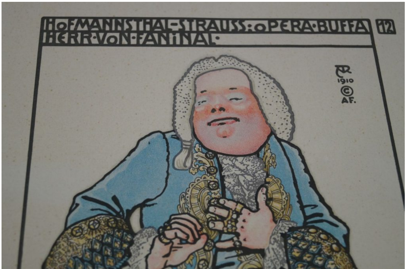
Herr von Faninal - Figurinen von Alfred Roller zu Richard Strauss' Rosenkavalier, Bestand SLUB Dresden

Fast zeitgleich stellte übrigens die Bayrische Staatsbibliothek München ihre Strauss-Bestände (und die des nun ebenfalls gemeinfreien Hans Pfitzner dazu) ebenfalls online. Und wenn die Gemeinfreiheit hier in Dresden vor allem zur Forschung aufruft, dürften sich auch freie Ensembles, Veranstalter und Bearbeiter in ökonomischer Hinsicht freuen: Strauss ist nicht nur frei und bedenkenlos aufzuführen, er wird nun auch günstiger. Ob das zu einem Rush in den Konzertsälen führen wird, bleibt abzuwarten. In Dresden zumindest verging auch bislang nahezu kein Jahr ohne Alpensinfonie und Rosenkavalier, und damit haben wir durchaus hier einen musikalischen Luxus, in dem weiterhin geschwelgt werden darf.