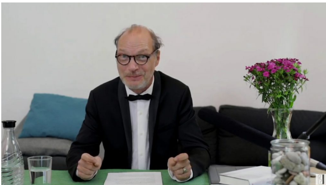
Martin Brambach mit Blumenbouquet live aus Recklinghausen.