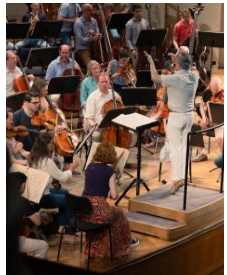
Fabio Luisi und die Wiener Symphoniker bei der Probe zum Konzert.

Es war ein Konzert, nach dem man zweimal überlegen musste, ob man tatsächlich noch einen Sonntagsbraten braucht. Denn musikalisch gab es zumindest keine leichte Kost, doch, um beim Vergleich zu bleiben, ein gutes Essen darf auch gerne komplex sein.