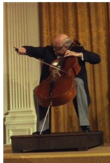
Mstislav Rostropowitsch (1978)

Nein, von einem Rostropowitsch-Schwerpunkt beim Wiener Musikverein ist eigentlich nichts bekannt. Und doch hatten zwei Sinfoniekonzerte, die gerade einmal im Abstand von 24 Stunden im Goldenen Saal stattfanden, vielmehr zufällig gleich zwei Cellokonzerte auf dem Programm, die für den russischen Meistercellisten geschrieben und von ihm auch uraufgeführt wurden. Auf einer alten EMI-CD sind beide Konzerte mit ihm sogar nebeneinander verewigt, und zeitlich entstanden sie um 1969/1970 fast parallel, insofern war der Live-Eindruck nun ein besonderer.